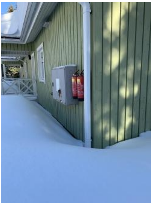
C-talon päädyssä pikapaloposti ja 2 käsiammutinta.